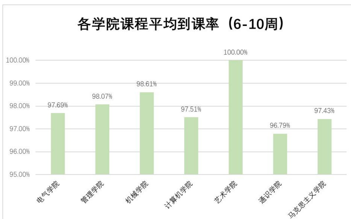
图3 各学院课程平均到课率 (6-10周)

(三) 各学院一如既往地狠抓课堂教学，教学秩序正常，学生学习热情较高，根据教务系统内选课人数及督导实际听课核实人数，总到课率为97.85%。根据各督导反馈的结果，到课率低于85%的授课班级共有3个。分别为：3月24日第一节《大学英语(2)》(网络2202班)，到课率81.63%；3月28日第二节《大学英语(4)》(机器人2101, 2102班)，到课率83.12%及4月21日第二节《机械设计》(车辆2101班)，到课率82.61%。