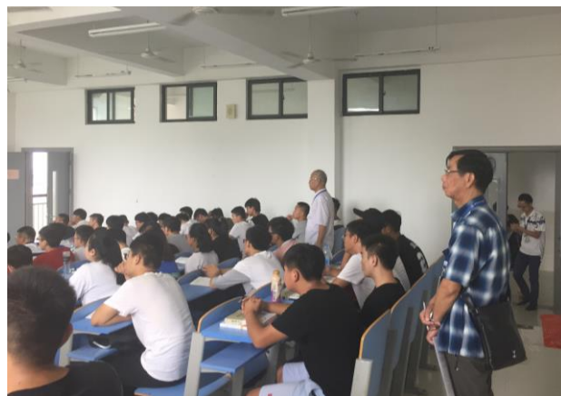
（督导参与开学第一天教学巡查）