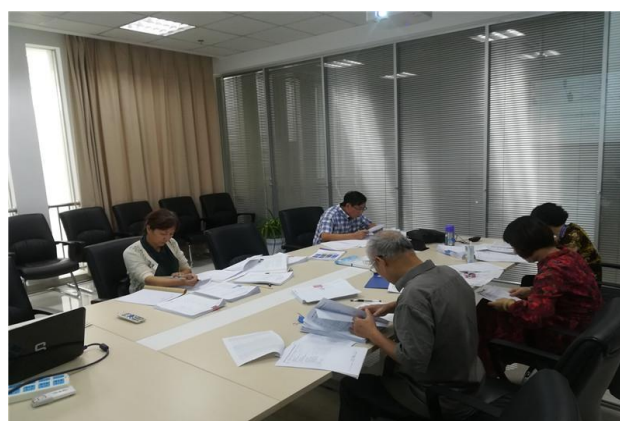
(督导们检查教学材料)